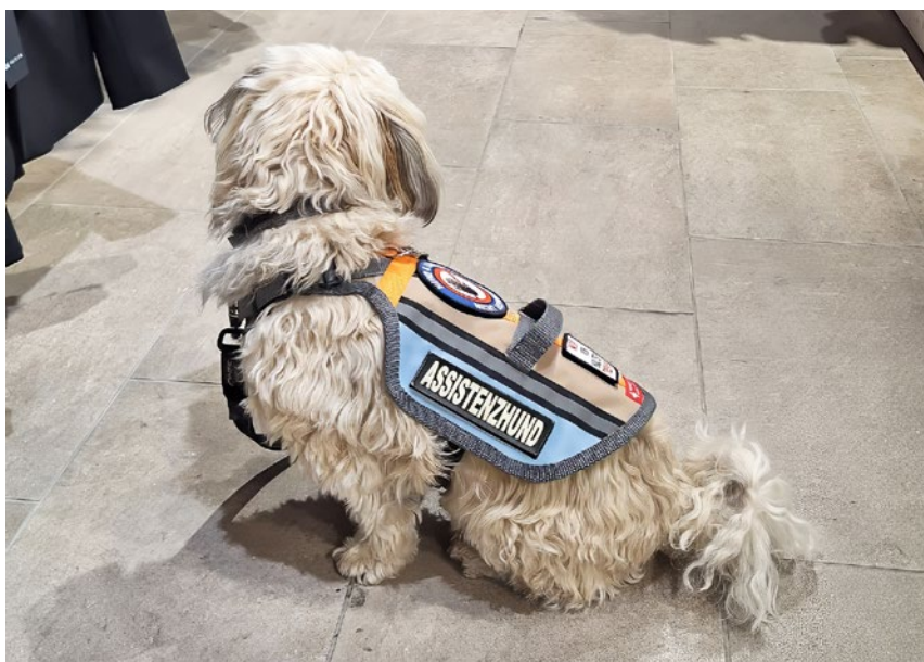
... und darum viel häufiger auf Skepsis oder Unverständnis stossen – gerade wenn man ihren Halter:innen die Beeinträchtigung nicht ansehen kann.

Ein zentrales Hindernis bleibt die gesellschaftliche Wahrnehmung. Während ein Blindenführhund sofort als solcher erkannt wird, ist dies bei anderen Assistenzhunden häufig nicht der Fall. Assistenzhunde leisten einen unschätzbaren Beitrag zur Selbstständigkeit und Teilhabe von Menschen mit Beeinträchtigungen. Die Schweiz verfügt über eine solide rechtliche Grundlage – doch im Alltag zeigt sich, dass das Wissen dazu noch nicht überall angekommen ist. Echte Inklusion bedeutet, Hindernisse aktiv abzubauen: durch Wissen, klare Regeln und gelebtes Verständnis. Erst wenn Assistenzhundeteams sich selbstverständlich und ohne Diskussion im öffentlichen Raum bewegen können, wird aus Recht auch tatsächliche Gleichberechtigung.