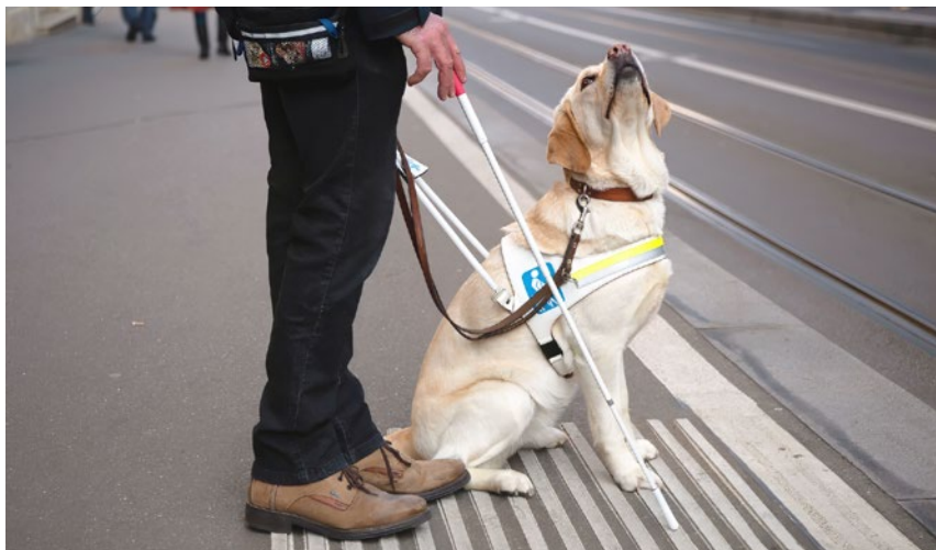
Blindenführhunde sind in der Gesellschaft breit anerkannt ...

Stiftung Schweizerische Schule für Blindenführhunde Allschwil