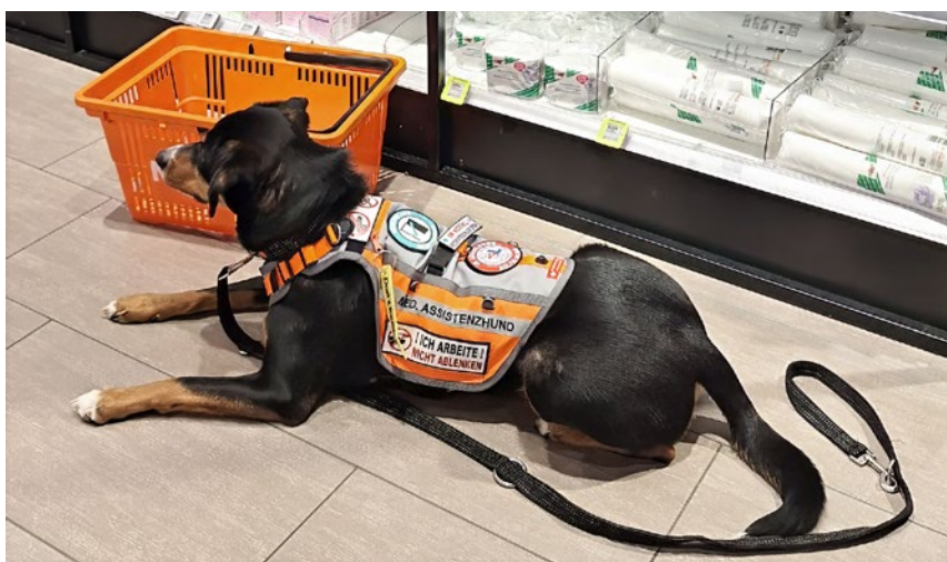
... während andere Assistenzhunde und ihre Aufgaben vielen Menschen weniger bekannt sind ...